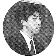
福井 講師 は、午前 成十二年四 月からスタ ートする

平成十一年九月十六日、岡山商工会議所四階会議室において、社団法人岡山ビルメンテナンス協会青年部主催による第六回研修会が、受講生二十五名の参加を得て開催された。