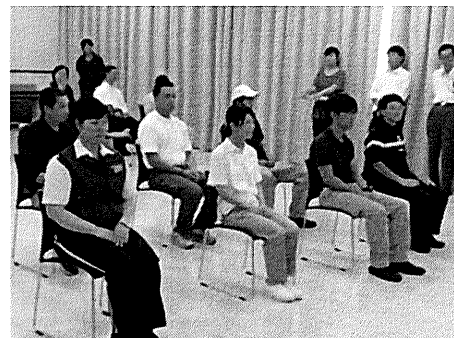
成績発表前の選手たち

岡山代表となられた4選手にアンケートにご協力いただき、中国大会の目標や意気込みを記入していただきました。