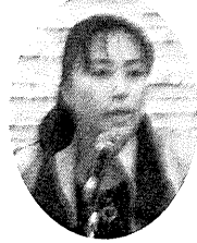
お招きし、各区の代表の方にパネルディスカッションをお願いいたしました。

15時半から行われた部会長会議においては、第7回大会となる翌年の西日本サミットが兵庫県で開催されることと決定いたしました。16時からのパネルディスカッションは、西日本サミットについても一度考えるための企画でした。