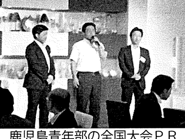
鹿児島青年部の全国大会PR

岡山ビルメンテナン協会 青年部HP http://okymbmj.minibird.jp/ 西日本サミットの詳細についてはトップ→「special」→「2012 西日本サミット IN 岡山」