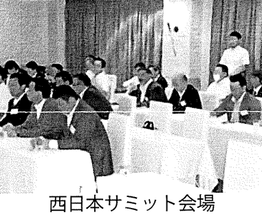
西日本サミット会場