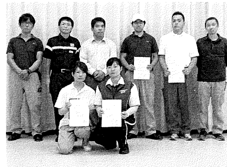
宮下副部長と出場選手