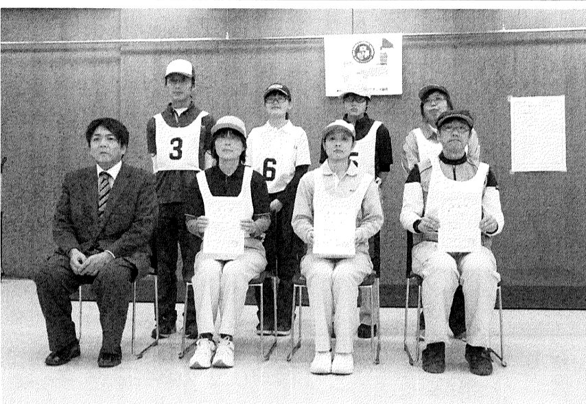
閉会式後の記念写真