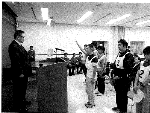
二分選手による選手宣誓

3選手の精進を期待しつつ、青年部一同の精一杯の応援、ご協力をお願いいたします。 (藤原)